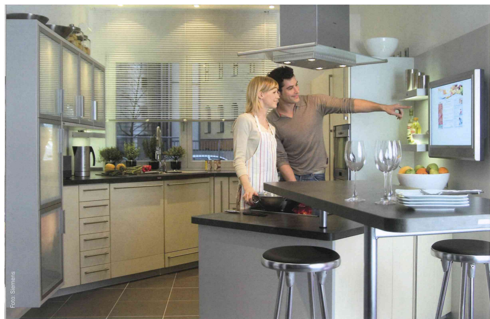
Auch private Haushalte werden mit intelligenter Steuerungstechnik zu Energiemanagern.

MeRegio konnte zeigen, dass sich die kritischen Netzzustände durch fluktuierende Einspeiser mit einem automatisierten Demand-Side-Management überwinden lassen. Dabei erhalten sogenannte Steuerboxen im Haushalt abhängig von den Netzparametern Preis-, Effizienz- oder Prioritätssignale und können den Verbrauch von Hausgeräten entsprechend vorziehen oder verschieben. Damit lassen sich mit marktlichen Mechanismen die Netze entlasten und die Versorgungssicherheit erhöhen. Die Bereitschaft der Stromkunden, ihren Verbrauch in die „grünen“ und günstigen Tarifzonen zu verlegen, ist vorhanden.