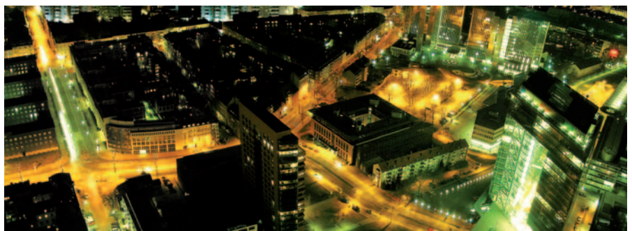
Smart Watts setzt in Aachen das Konzept der intelligenten Kilowattstunde um

des Preises, der Netzlast oder der momentanen Windeneinspeisung, den Betrieb von Haushaltsgeräten steuern. „Aus unserer Sicht tragen Bezugskonditionen in Kombination mit intelligenten Haushaltsgeräten maßgeblich dazu bei, dass die Nachfrage nach Energie flexibler wird und sich verstärkt an einer fluktuierenden Erzeugung orientieren kann“, so Christoph Heinemann von EnCT.