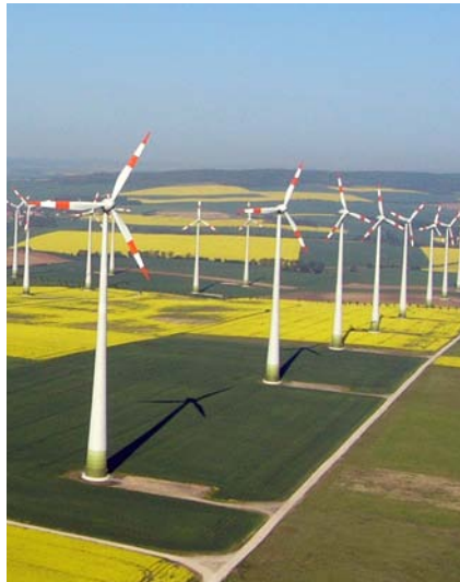
Die Modellregion RegModHarz verfügt über einen hohen Anteil erneuerbarer Energien

Die Modellregion „Regenerative Modellregion Harz“ startete Anfang September eine Befragung zum Stromverbrauch im Landkreis Harz mit dem Ziel Konsumenten dazu anzuregen, ihren individuellen Stromverbrauch zu ermitteln. Zukünftig sollen die Bürger aus der Region ihren Strombedarf genau beobachten und, wenn möglich, in Zeitfenster verlegen, in denen erneuerbare Energien Strom liefern können. Insgesamt 2.500 Haushalte bittet das Projektkonsortium aus dem Landkreis Harz um ihre Antworten. Mit der Befragung untersucht das Projekt beispielsweise die Ausstattung mit Haushaltsgeräten, die Verwendung von erneuerbaren Energien, das Interesse an Elektroautos, das Wissen zum Thema